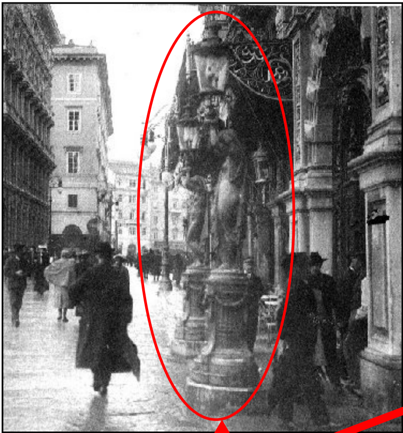
1936 TINZA E MARIANZA Piazza Unità d'Italia Palazzo del Municipio